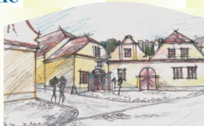
Mikroregionální komunitní centrum, perspektiva – Jiráskova ulice

V příštím roce se naše Sdružení měst a obcí Vltava pustí do finální realizace společného projektu Mikroregionálního komunitního centra, které se bude nacházet v Jiráskově ulici. Na rekonstrukci současného stavu budovy bude v nejbližší době vyhlášeno výběrové řízení.