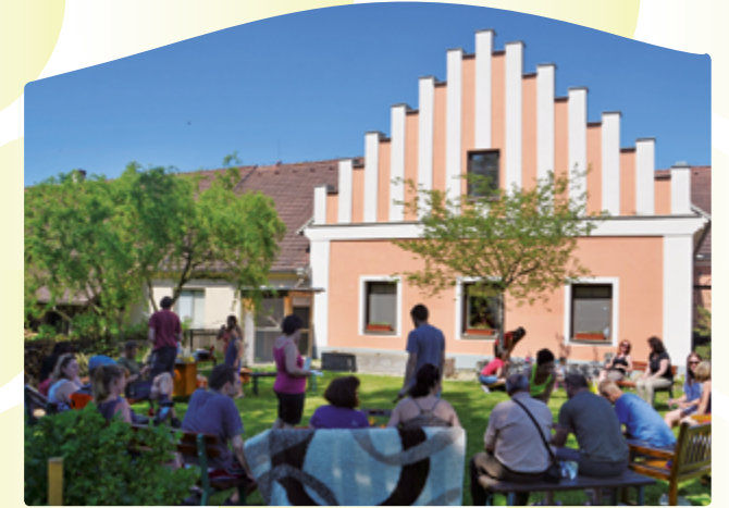
Domov sv. Anežky

Na oslavách 20. výročí se sejdou ti, kteří se o založe- ní Domova sv. Anežky zasloužili nebo se podílejí na jeho současné činnosti a také spolupracovníci, klienti, přátelé