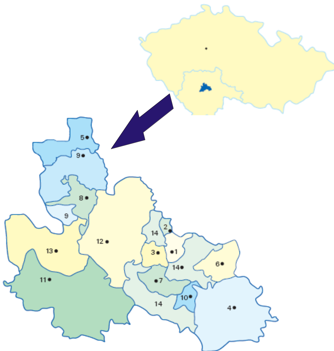
Obrázek 3 Území působnosti MAS Vltava s vyznačením hranic obcí